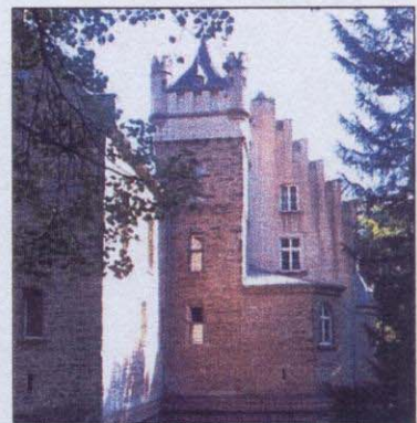
Zu einer Zeitreise durch die Erdgeschichte lädt das Museum für Ur- und Frühgeschichte in Werdringen.

Kontakt zur Band unter 0178/6340908 oder per Mail an eightball@freenet.de.